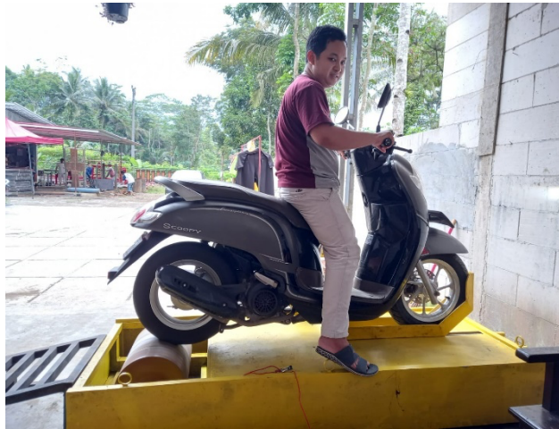
Gambar 4. Software Monitoring

GaSatu set mekanik roller konsep inersia single Roller (berat roller 150 kg) berat keseluruhan sasis dengan roller 200 kg, single roller digunakan sebagai tempat kendaraan yang nantinya akan diuji, dimana nanti motor dijalankan di atas single roller yang nantinya roller ikut berputar dan nantinya sensor mendapatkan data dari perputaran roller tersebut.