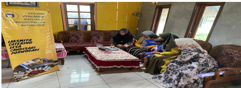
Gambar 4. Pelaksanaan Kegiatan Workshop Optimalisasi Pemanfaatan Digital Marketing dan Penambahan Modal

Pelaksanaan kegiatan workshop pemanfaatan digital marketing untuk meningkatkan penjualan dilakukan dengan memberikan edukasi kepada mitra, dilanjutkan dengan kegiatan praktek memanfaatkan Media Sosial untuk optimalisasi digital marketing. Mitra diberikan informasi dan praktek secara langsung bagaimana trik-trik melakukan pemasaran menggunakan Media Sosial seperti: Facebook, WhatsApp, Instagram. Mitra langsung diajak praktik membuat video-video dan caption yang menarik untuk meningkatkan pemasaran. Bagaimana menjalin komunikasi yang baik dengan konsumen-konsumen yang sudah dimiliki saat ini dan mengajak calon konsumen baru untuk mencoba dan membeli produk-produk Laksmiina Catering. Yang terakhir adalah penyerahan pendampingan modal kepada mitra agar bisa mampu meningkatkan produksi dan melakukan diversifikasi bisnis dengan menjual barang-barang kebutuhan rumah tangga dan produk-produk kecantikan.