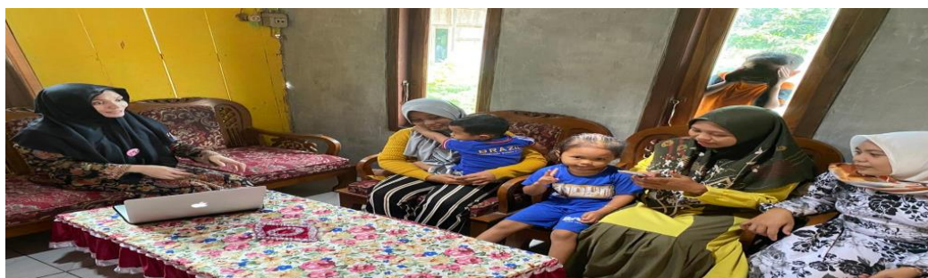
Gambar 5. Praktek Pemanfaatan Digital Marketing Menggunakan Medsos