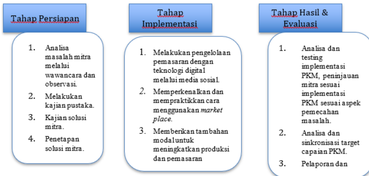
Gambar 2. Tahapan Kegiatan