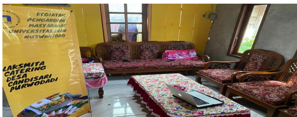
Gambar 3. Persiapan Kegiatan Workshop

Kegiatan pengabdian masyarakat ini dilaksanakan pada hari Sabtu, 14 Mei 2022 di Laksmi Catering Catering, RT/RW, 05/02 Desa Candisari, Kecamatan Purwodadi, Kabupaten Grobogan Jawa Tengah. Kegiatan workshop peningkatan penjualan melalui optimalisasi pemanfaatan digital marketing dan penambahan modal dimulai pada pukul 09.00. Kegiatan dimulai dengan kegiatan persiapan yang dilanjutkan dengan kegiatan pembukaan dan pembacaan susunan acara yang dilakukan oleh moderator atau MC (Master of Ceremony) sampai pukul 09.10. MC merupakan panitia kegiatan yang berasal dari mahasiswa Universitas Dian Nuswantoro. Kegiatan dilanjutkan dengan menyanyikan lagu Indonesia Raya yang dipimpin oleh panitia. Seluruh peserta, panitia, dan narasumber ikut dengan hikmat menyanyikan lagu tersebut. Acara dilanjutkan dengan penyampaian materi tentang pentingnya optimalisasi penggunaan digital marketing oleh Nara Sumber Pertama. Tujuan penyampaian materi ini adalah memberikan pengetahuan secara jelas dan mudah dipahami kepada Laksmi Catering tentang apa itu digital marketing, manfaat digital marketing, dan strategi pemanfaatan digital marketing menggunakan Media Sosial.