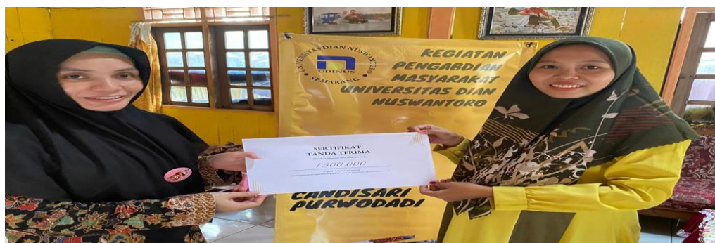
Gambar 6. Penyerahan Penambahan Modal

Secara sistematis kegiatan pengabdian kepada masyarakat ini dijelaskan pada tabel capaian kegiatan ini