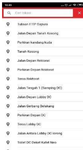
Gambar 3. Daftar Ruangan