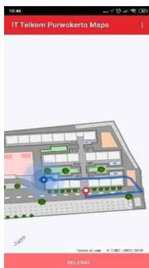
Gambar 4. Rute Tujuan

Tampilan menunjukkan rute tujuan menuju ruangan yang di cari dengan posisi pengguna dan tujuan pengguna.