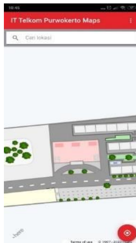
Gambar 2. Denah Ruangan

Tampilan halaman denah menginformasikan berupa denah ruangan yang ada di IT Telkom Purwokerto.