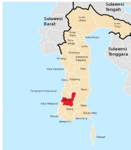
Gambar 1. Gambar Latak Topografi Kabupaten Maros

Terbitnya Inpres Nomor 3 Tahun 2003 menjadi titik awal penerapan e-government di Indonesia. Inpres tersebut menekankan pentingnya pemanfaatan teknologi informasi dan komunikasi (TIK) dalam organisasi pemerintah guna penyelenggaraan pemerintahan yang efektif dan efisien. E-government diharapkan dapat mengeliminasi sekat-sekat birokrasi, serta terbentuknya jaringan sistem manajemen dan proses kerja yang memungkinkan berbagai instansi pemerintah dapat bekerja secara terpadu untuk menyederhanakan akses informasi dan proses layanan. Sejak saat itu berbagai organisasi pemerintah baik di tingkat pusat maupun daerah mulai bergerak dalam memanfaatkan TIK untuk mengimplementasikan e-government di daerahnya [1].