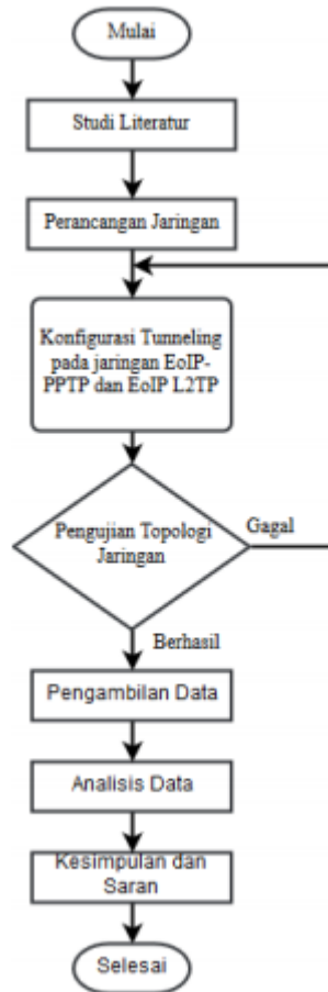
Gambar 1 Alur Penelitian